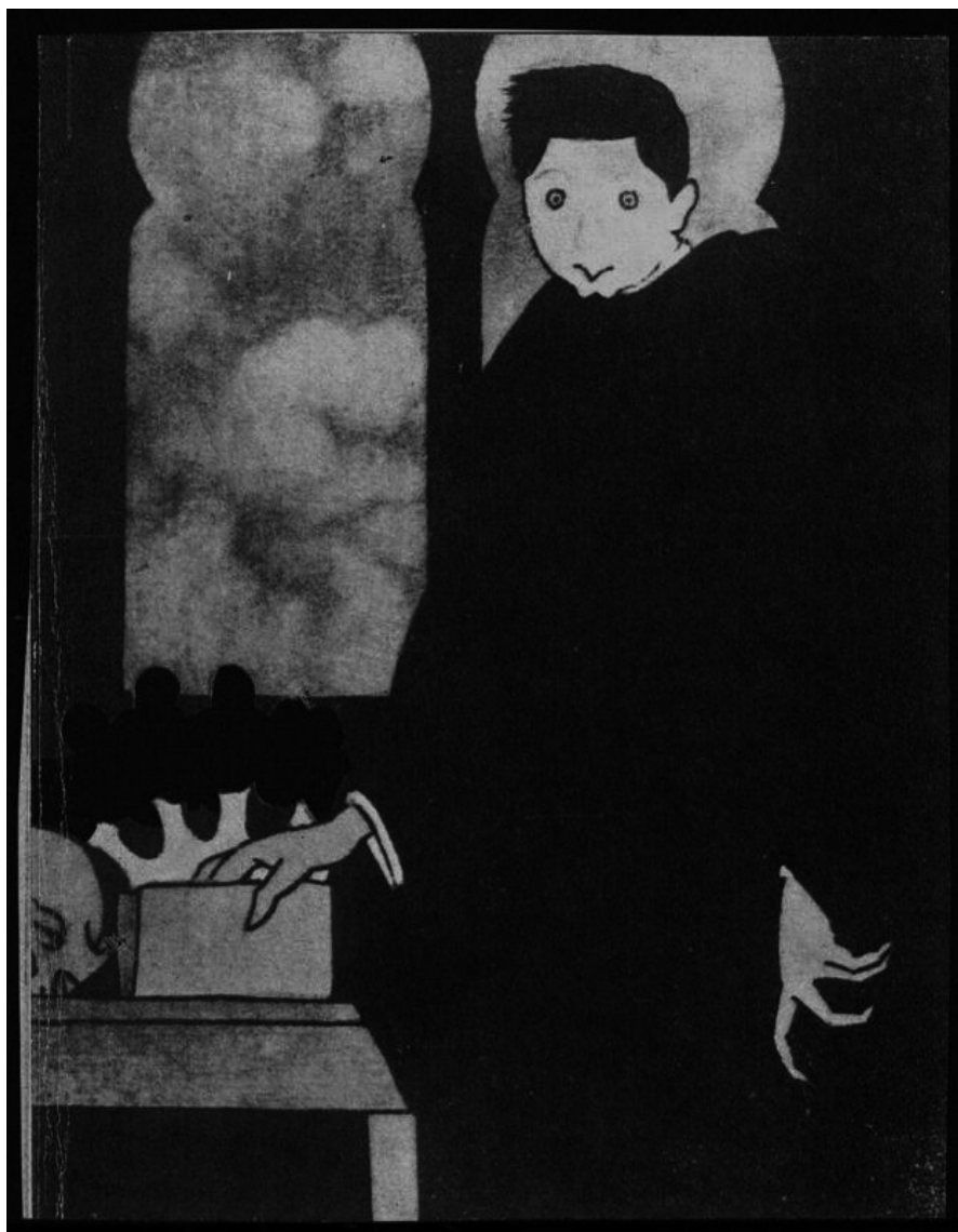
Caricatura de Castelao por Antonio Rey Soto (1914)